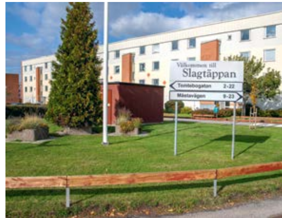
Slagtäppan har sex innergårdar med lekparkar och grillplatser, boule-bana, fotbolls- och basketplan.