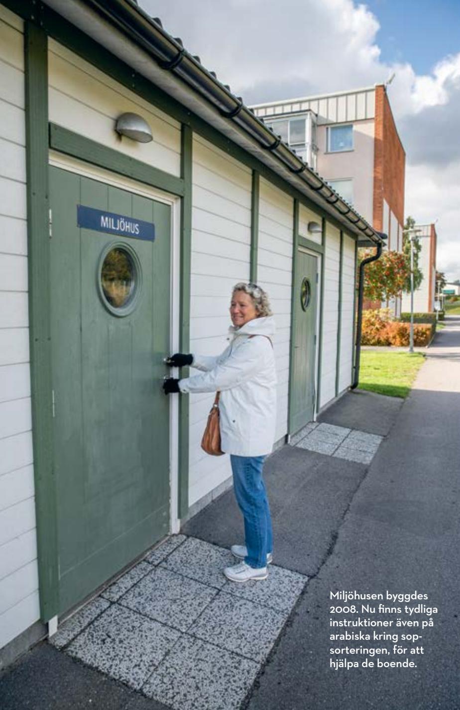
Miljöhusen byggdes 2008. Nu finns tydliga instruktioner även på arabiska kring sopsorteringen, för att hjälpa de boende.