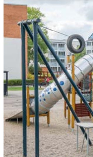
Den stora lekparken är mycket uppskattad bland traktens barn, inte bara de som bor i HSB brf Slagtäppan.