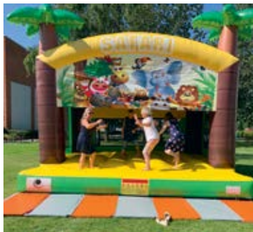
På jubileumsfesten bjöds på grillat och en trubadur underhöll gästerna. Barnen - och även vissa styrelsemedlemmar - föredrog att hänga i hoppborgen.